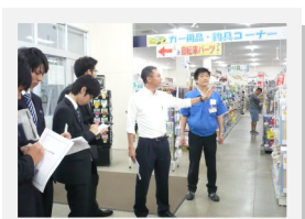
スーパーセンターアマノさんで売り場を見学する様子。

応募前見学会は、訪問型の企業説明会。訪問といっても複数名(最少催行2人)の参加ですし、フレッシュワークAKITAの職員が同行するので安心です。最寄駅から企業までは送迎無料のタクシーをご用意。(現地集合の場合もあります。)採用担当者から企業や採用に関する詳しい話を聞き、職場を見学することで職場の雰囲気を体感できます。44歳までの求職中の方・来春卒業の学生の方が対象です。