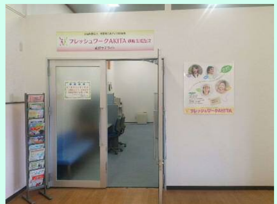
南部サテライト入口