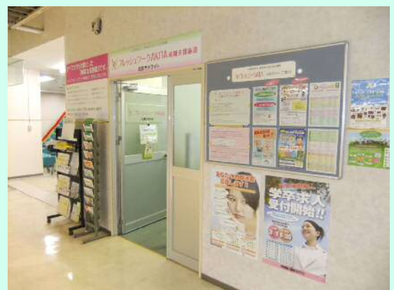
北部サテライト入口

「笑顔と挨拶を大切に☆ あなたの“やる気・元気・勇気”を 応援させていただきます！」